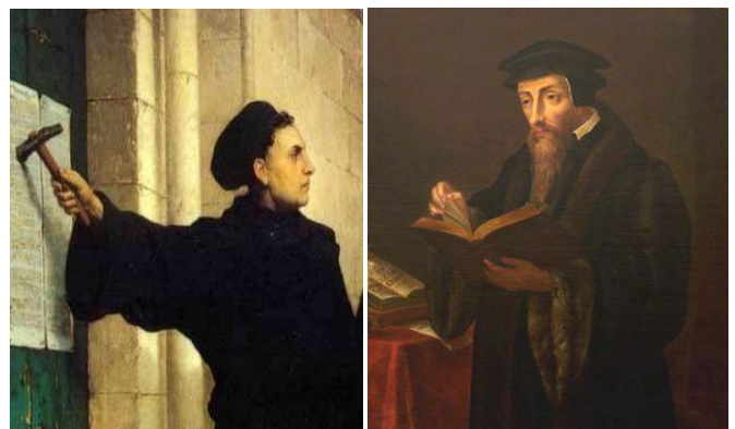
Luther Márton és Kálvin János